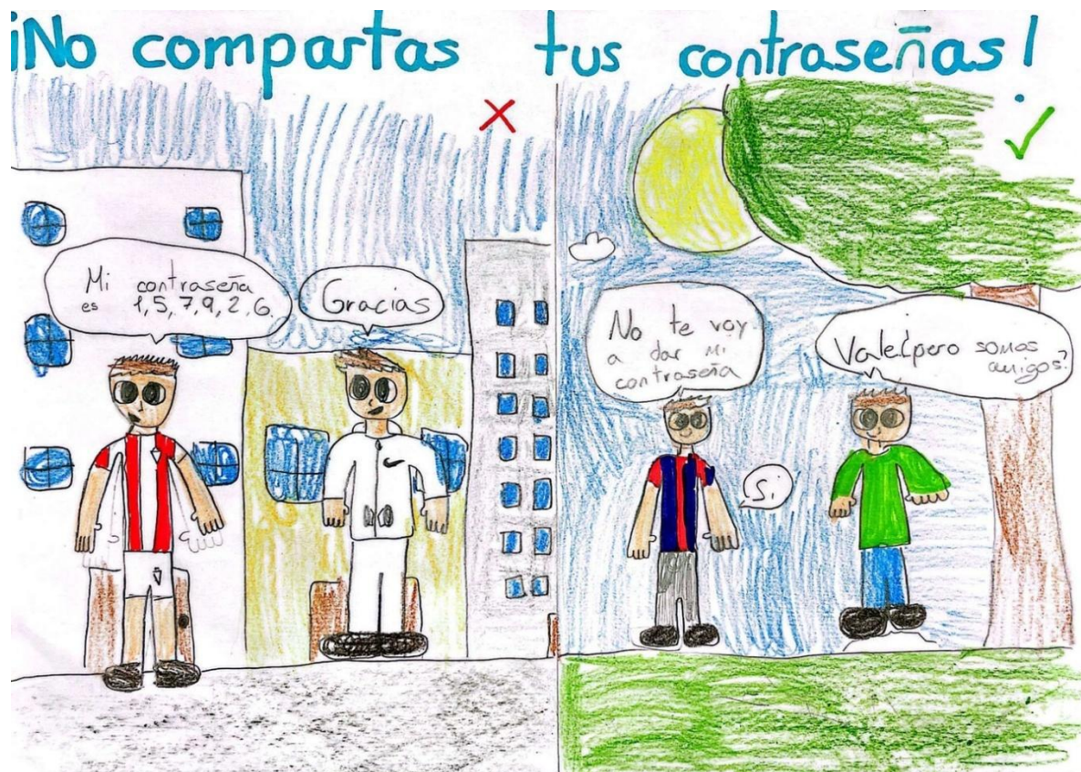
Ilustración 7 Dibujo ganador en la categoría de dibujos

Se programaron tres actividades destinadas de forma especial a cada franja de edad: primaria, secundaria y bachiller abiertas a la participación de cualquier centro escolar de la Comunidad Iberoamericana de Naciones.