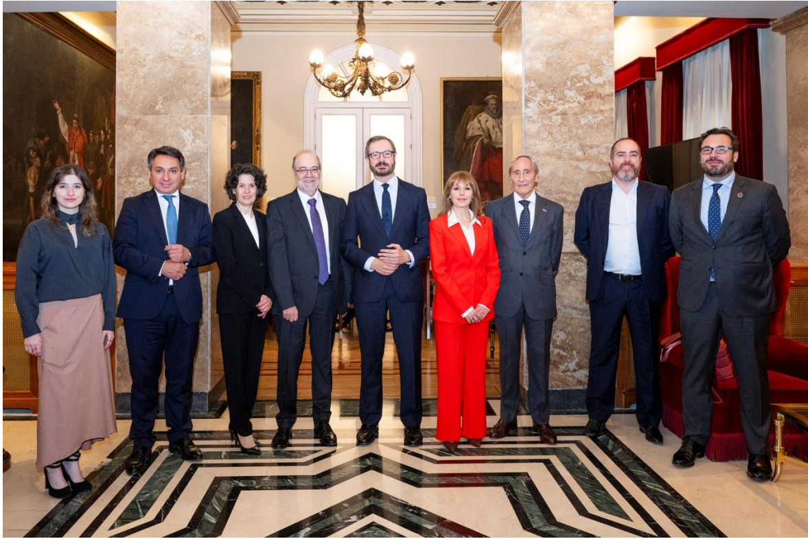
Ilustración 2 Foto de familia con patrocinadores, organizadores y premio a la trayectoria