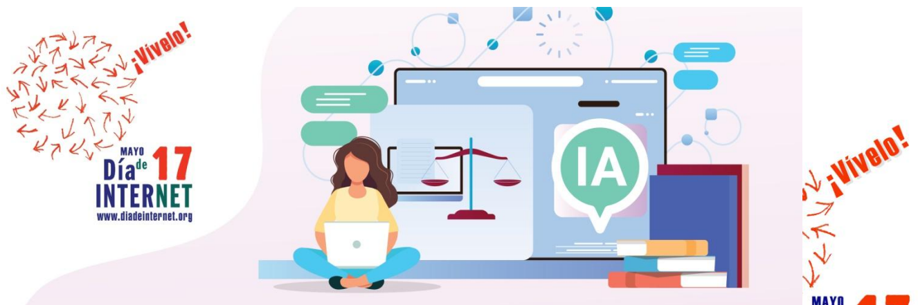
Ilustración 10 Portada del concurso de INTEF