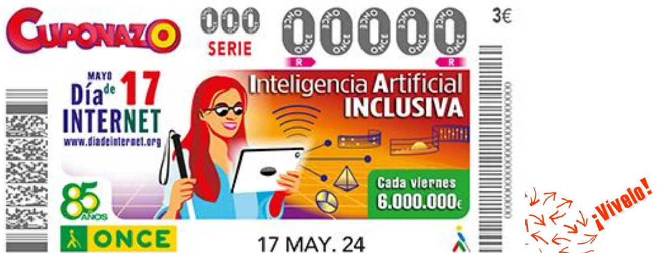
Ilustración 6 Cuponazo de la ONCE del 17 de mayo dedicado al #diadeinternet

Los cupones de la ONCE se comercializan por los más de 20.000 vendedores y vendedoras de la Organización. Además, se pueden adquirir desde Once.es, y en establecimientos colaboradores autorizados.