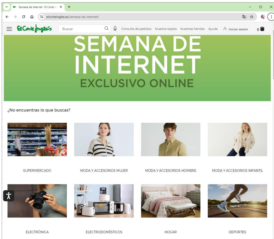
Ilustración 11 Web de El Corte Inglés dedicado a la #semanadeinternet

El Corte Inglés, Shopee, Fnac, Carrefour, ToysRUs, Worten, PC Componentes, son sólo algunos de los comercios que han participado en esta edición de la Semana de Internet.