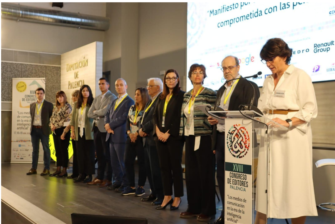
Ilustración 1 Lectura del Manifiesto en Palencia (Congreso CLABE)

El manifiesto se elaboro en los meses de Enero a Marzo y fue presentado en sociedad en el Congreso de CLABE celebrado, este año en Palencia, en el cual se procedió a dar una lectura compartida por representantes de las diferentes instituciones que componen el Comité de Impulso del #diadeinternet y posteriormente el 17 de mayo se volvió a leer en el Senado.