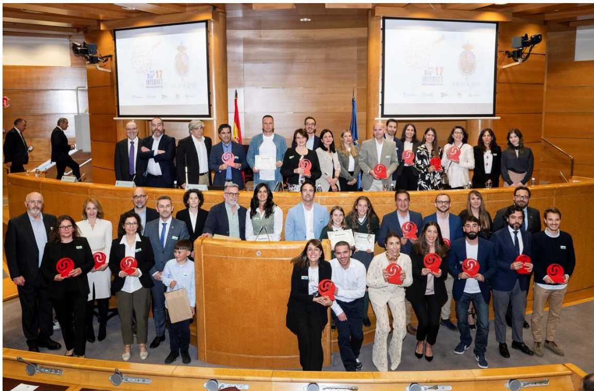
Ilustración 5 Foto de familia con todos los ganadores de los Premios de Internet 2024