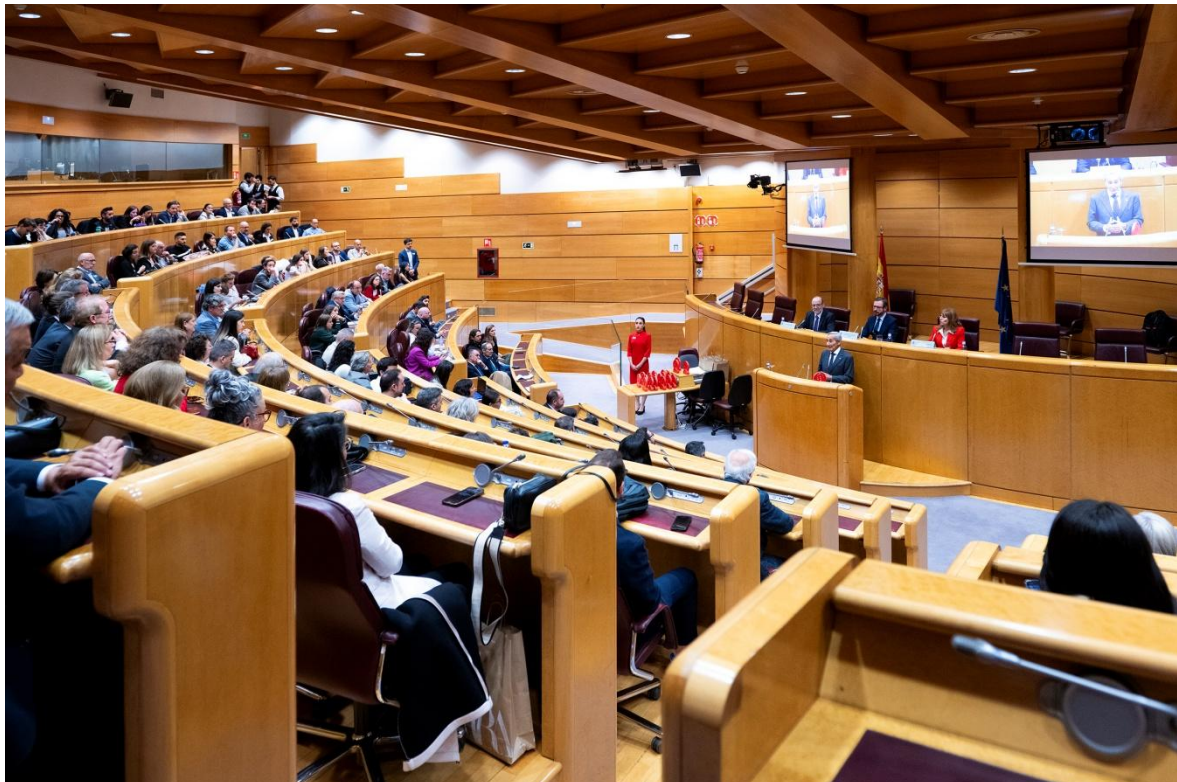
Ilustración 3 Vista general de la Sala Europa del Senado durante la celebración del #diadeinternet